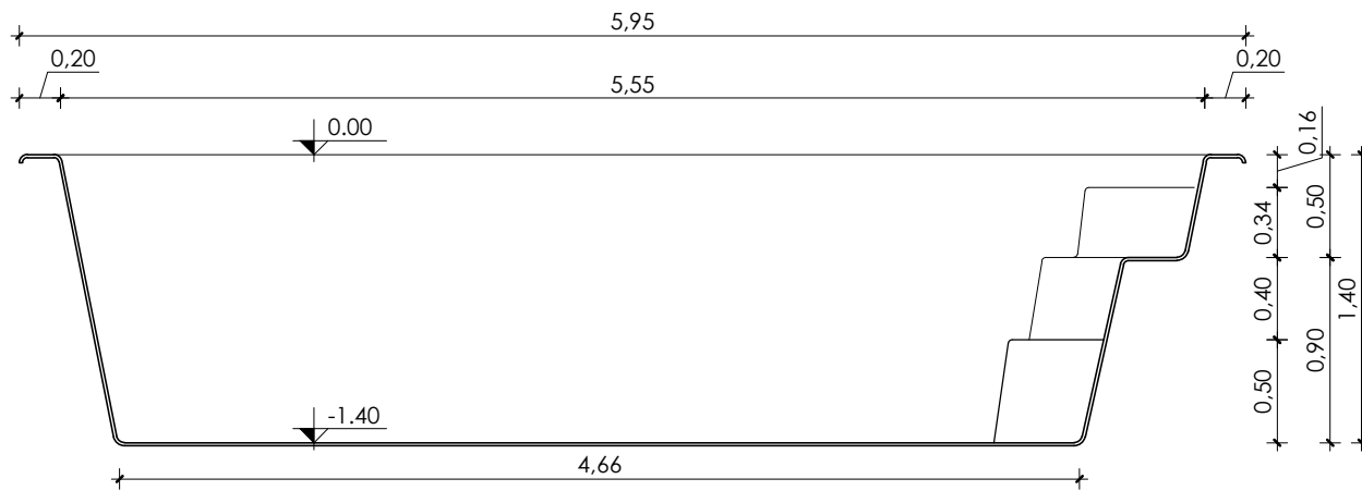
Corte Longitudinal Esc.: 1:40